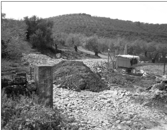
PIE de FOTO: ejemplo de utilización de la maquinaria de la Mancomunidad para arreglar un camino particular.

La utilización arbitraria de la maquinaria de la Mancomunidad, arreglando cunetas dependiendo del color político del dueño de los olivos, algunas veces incluso, caminos particulares con la maquinaria pública.